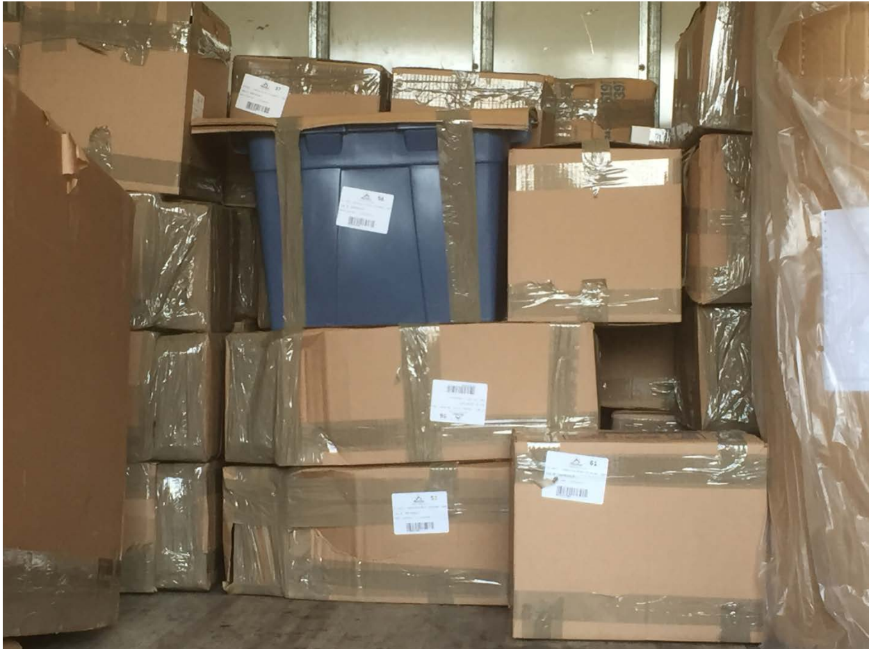
New Yorko konsulato archyvas sunkvežimiu perkeliamas iš ALKOS į laivą.

2016 m. sausį iš ALKOS buvo išvežtas Lietuvos generalinio konsulato New Yorke archyvas. Archyvą sudaro istoriškai vertingos medžiagos daugiau nei 60 dėžių.