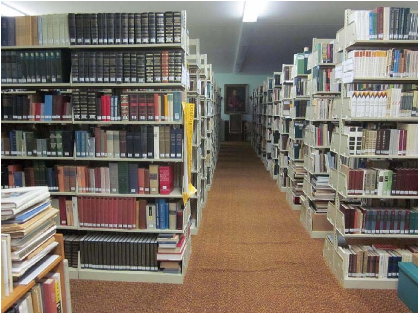
ALKOS biblioteka (nuotr. Dalės Lukienės)

LKMA valdyba dėkoja Nekalto prasidejimo vienuolėm, kad taip šiltai ir vaišingai priėmė LKMA suvažiavimo dalyvius, dėkoja prelegentams už įdomias ir suprantamas paskaitas ir dėkoja dalyviams, kad jie nepabijojo dalyvauti ir netgi su tikru susidomėjimu statė klausimus bei darė pastabas.